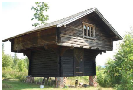
«Et hus med fire søyler»- (tanker lånt fra et foredrag om rammeplanen 2017)

Lenger fremme i årsplanen kan dere lese om disse fire viktige søylene som nevnes ovenfor, samt Visjonen vår som er; - vi tar tiden tilbake -, satsningsområde barns medvirkning , satsningsområde Miljøvern , men ellers alle fagområdene, og andre viktige områder innen barnehagens pedagogiske virksomhet. Utover dette så deltar vi i ulike prosjekter sammen med andre barnehager i kommunen. Vi har et eget nettverk bestående av Kråkjordet, Hunnshovde, Lissomskogen og oss. Her har temaet livsmestring og helse vært og er et gjennomgående tema. Dette temaet finner vi igjen i alle fagområdene. Språk, sosialkompetanse og lek som eksempler. I nettverkene kan vi ha felles personalmøter/kursing og felles opplegg med barna på tvers av barnehagene, men også andre typer erfaringsutveksling og læring.